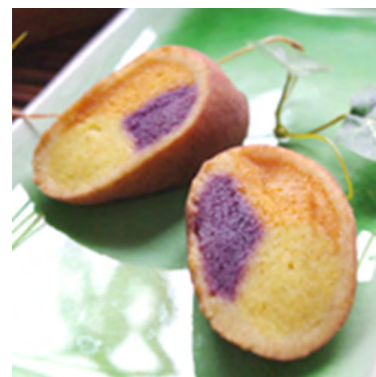
圖 1. 地瓜頭目

引入 ibeacon 倉儲定位系統，原物料進倉時間、保存期限、放置位置都經過規劃，倉管人員可透過配置的手持裝置進行物料搬運和尋找的工作。另外也透過管理系統紀錄倉庫溫度變化，一般傳統 RFID 無法做到，隨時觀察保存條件的改變。